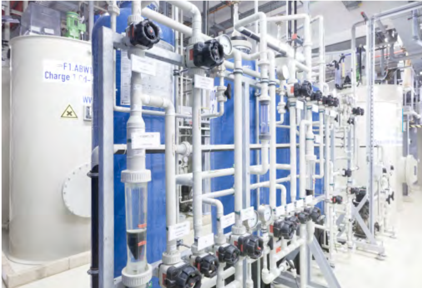
Установка селективного ионного обмена для удаления кадмия.

Selective ion exchange plant for the removal of cadmium.